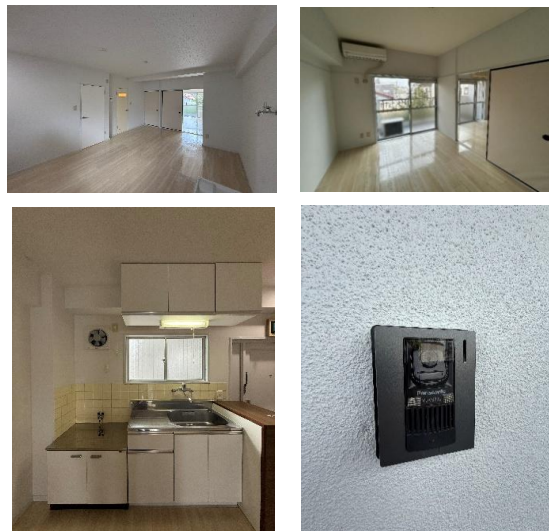
※写真はおよそのイメージです。