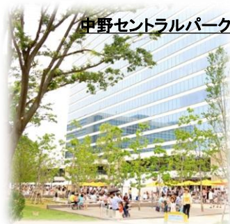
中野セントラルパーク