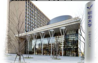
明治大学 中野キャンパス