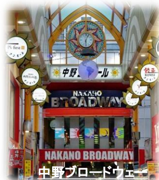
中野ブロードウェイ