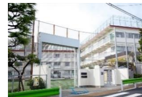
八雲小学校 徒歩5分