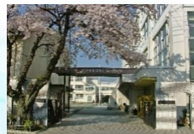
目黒区立第十中学校 徒歩9分