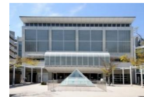
八雲中央図書館 徒歩9分