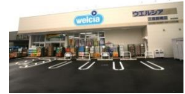
↑ウエルシア 徒歩7分(約550m)