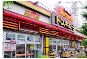
↑ドン・キホーテまで徒歩2分