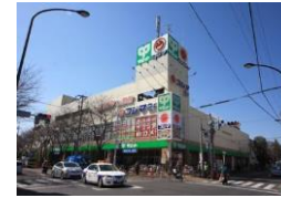
↑スーパーサミット 徒歩10分(約800m)