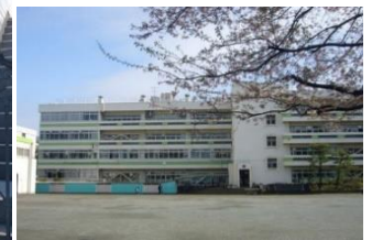
第七小学校 徒歩4分