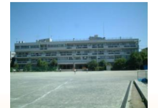
第二中学校 徒歩5分