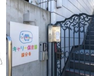
建物内認可保育園あり