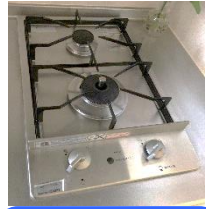
お料理がしたくなる 2口ガスコンロ