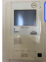
女性の強い味方! モニター付インターホン