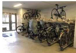
屋内駐輪場完備! 防犯カメラあり!