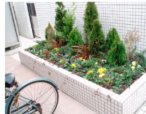
■エントランスには植物