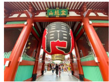
※東京でも有名な観光地のひとつ。 巨大な提灯を掲げる雷門は浅草のシンボルです。

※事務所の場合： 1. 別途消費税 2. 解約予告3ヶ月前 3. 保証金2ヶ月 (退去時償却・原状回復費用を含まない) ペット飼育の場合： 1. 敷金1ヶ月増 (退去時償却・原状回復費用を含まない)