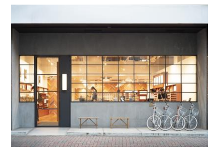
※近年、蔵前駅は「東京のブルックリン」。 古い町並みを活かした、 おしゃれなカフェなどが軒を連ねます。