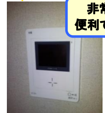
女性の強い味方！モニター付インターホン