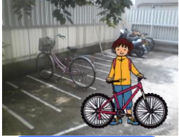
他には無い無料自転車置き場完備！