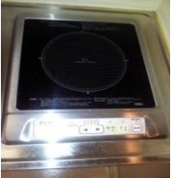
お料理がしなくなるIHクッキングヒーター