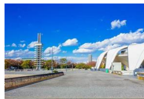
駒沢オリンピック公園 徒歩9分