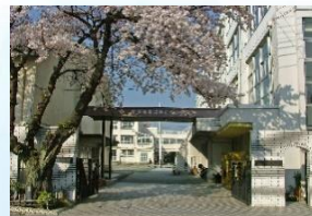
目黒区立第十中学校 徒歩9分