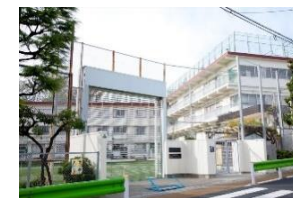
八雲小学校 徒歩5分