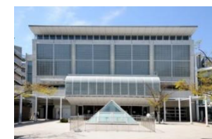
八雲中央図書館 徒歩9分