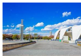
駒沢オリンピック公園 徒歩9分