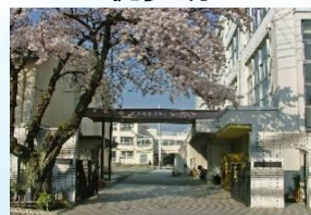
目黒区立第十中学校 徒歩9分