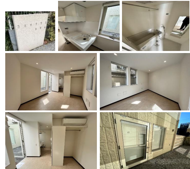
※図面と現況が異なる場合は現況を優先致します