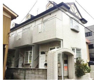
閑静な住宅街の物件