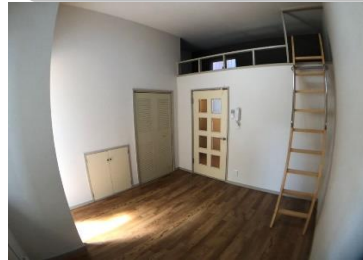
使い方はあなた次第！ロフト付！！