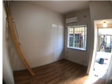
奥行き感の出るお洒落な出窓