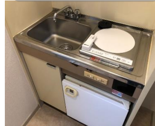
嬉しいミニ冷蔵庫付き