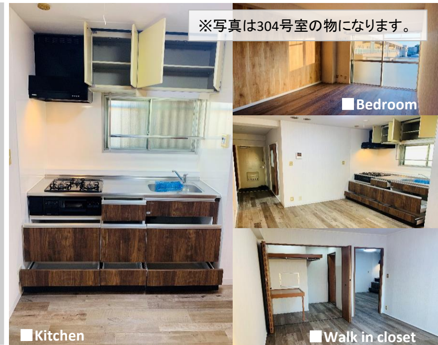
※写真は304号室の物になります。