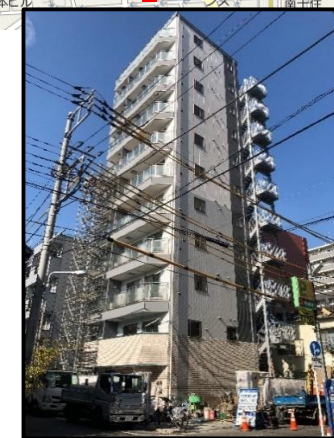
図面と現況が異なる場合は現況を優先致します。