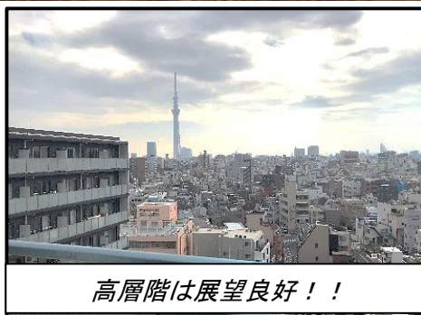
高層階は展望良好！！