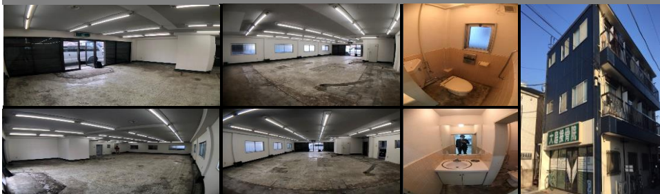
1階路面 貸店舗・貸事務所