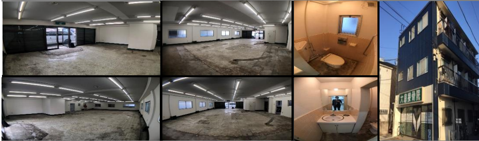
1階路面 貸店舗・貸事務所