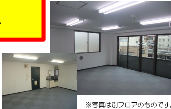
※写真は別フロアのものです。