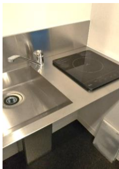
他の部屋写真参照