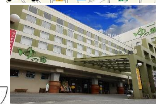
天然温泉ゆの郷 徒歩6分