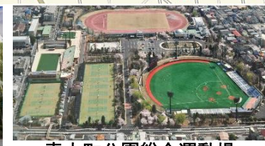
青木町公園総合運動場 徒歩3分