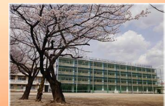
幸並中学校 徒歩10分