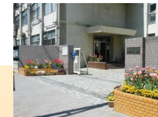
上青木南小学校 徒歩4分