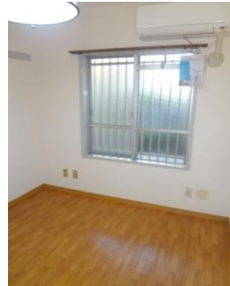
南向きの明るい洋室