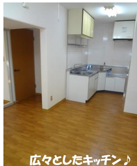
広々としたキッチン♪