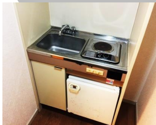
嬉しいミニ冷蔵庫付き