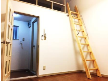
使い方はあなた次第！ロフト付！！