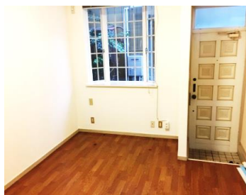
奥行き感の出るお洒落な出窓