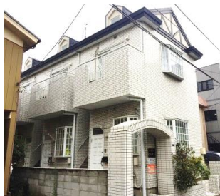
閑静な住宅街の物件