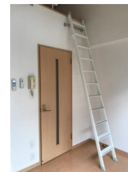
※図面・写真と現況が異なる場合は現況を優先致します

【物件名】シャンテ板橋本町B 【所在】東京都板橋区宮本町67-7 【建物】構造：鉄骨造3階建て 竣工：平成16年6月 【賃貸条件】共益費3,000円(共通) 敷金：なし 礼金：なし 普通賃貸借契約：2年間 更新手数料：新賃料の1ヶ月分 1年以内解約違約金あり 入居日：8月中旬 室内清掃費：50,000円(入居時・税別) 鍵交換費：20,000円(入居時・税別) 指定火災保険加入(2年間：20,000円) 当社指定保証会社加入必須 初回保証料：賃料・共益費の50%～ 更新保証料：1万円/年 ※保証会社によって保証料の増減あり 設備：エアコン/オートロック/室内洗濯機置場/ 給湯器/ドアホン/