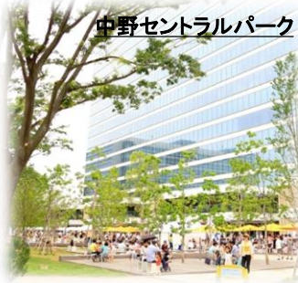
中野セントラルパーク