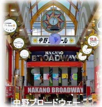
中野ブロードウェイ