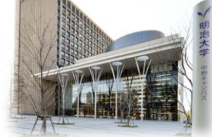
明治大学 中野キャンパス