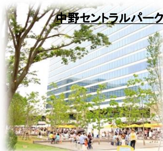
中野セントラルパーク