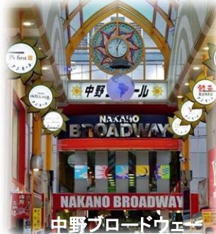
中野ブロードウェイ