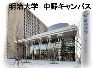
明治大学 中野キャンパス