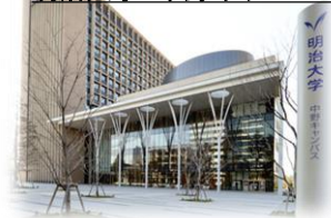
明治大学 中野キャンパス