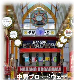
中野ブロードウェイ