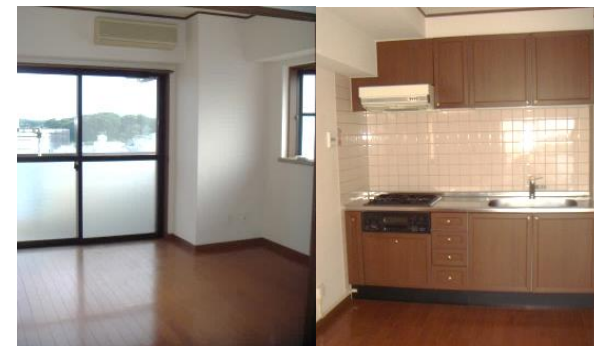
図面と現況が異なる場合、現況を優先いたします