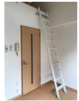
※図面・写真と現況が異なる場合は現況を優先致します